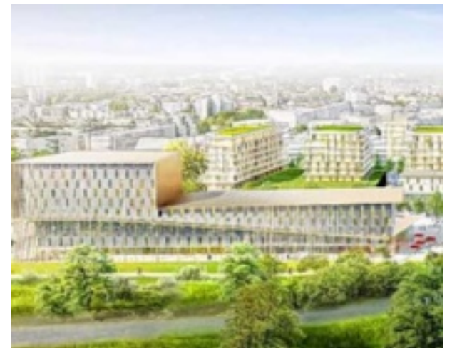
L'enquête publique est lancée pour le projet Rive de Veste.

L'Aisne, les Ardennes et la Marne comptent treize aérodromes civils où passionnés de tous âges peuvent piloter en club. Embarquement. PAGES 4 ET 5