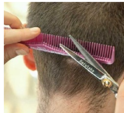
Il y a 656 coiffeurs dans la Marne, auto-entrepreneurs compris, dont 435 installés en salon.

Quelque 10 % des salons de coiffure rémois sont dans l'illégalité. En cause, des personnels qui n'ont pas le diplôme pour exercer cette profession. PAGE 7