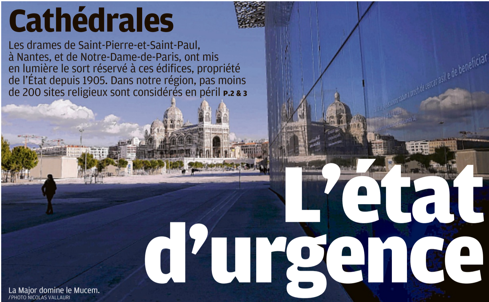
La Major domine le Mucem.

Les drames de Saint-Pierre-et-Saint-Paul, à Nantes, et de Notre-Dame-de-Paris, ont mis en lumière le sort réservé à ces édifices, propriété de l'État depuis 1905. Dans notre région, pas moins de 200 sites religieux sont considérés en péril P.2 & 3