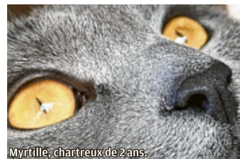
Myrtille, chartreux de 2ans.