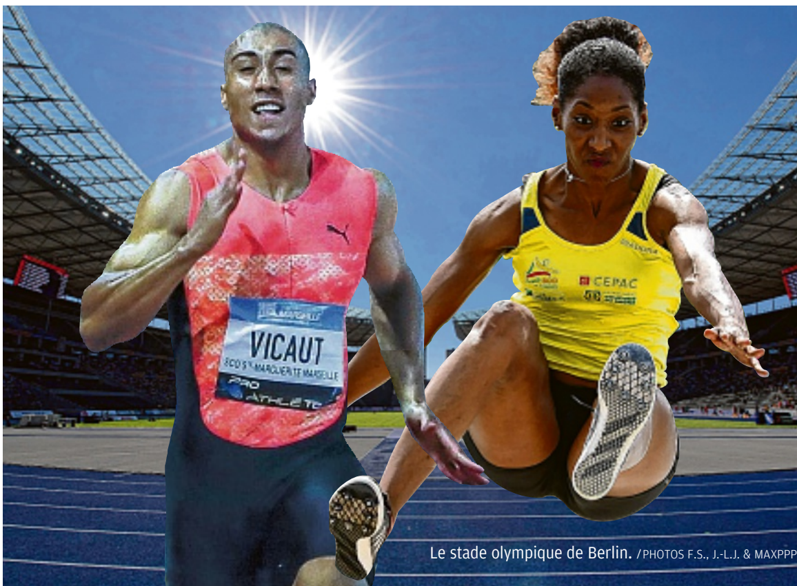
Le stade olympique de Berlin.

12 décembre 2014. Ouverture de La Grande Maison, à Bordeaux.