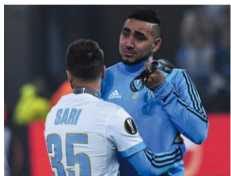
Pages 9, 26 et 27