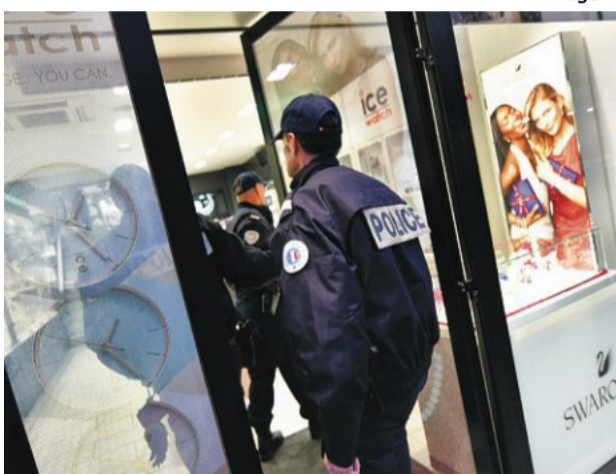
À l'approche des fêtes de fin d'année, le plan anti hold-up est activé. Cette opération vise à prévenir la commission des vols à main armée et autres faits de délinquance dans les commerces, notamment sur l'agglomération cherbourgeoise.

Cherbourg. Sécurisation Les commerces sous haute surveillance Page 2