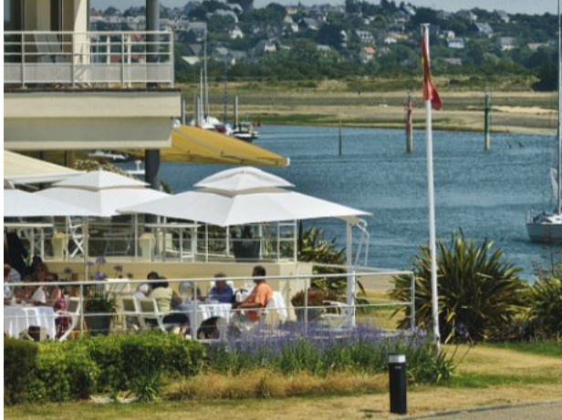
Par décret du 28 novembre, Barneville-Carteret vient d'accéder au rang de « station de tourisme ». Il s'agit de la seule dans la Manche pour l'instant.

Tourisme. Unique dans la Manche Barneville-Carteret classée « station » Page 3