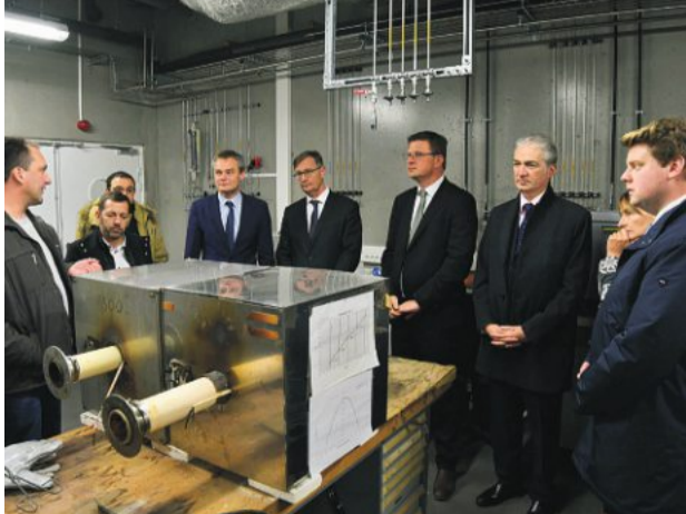
Hier, l'extension du hall technologique du Laboratoire universitaire des sciences appliquées de Cherbourg (Lusac), a été inaugurée par un certain nombre d'élus. Le site abrite dorénavant plus d'une quarantaine de chercheurs.

Cherbourg. Extension du Lusac Le pôle de recherches inauguré Page 7