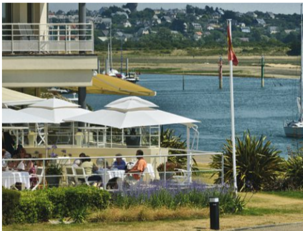
Par décret du 28 novembre, Barneville-Carteret vient d'accéder au rang de « station de tourisme ». Il s'agit de la seule dans la Manche pour l'instant.

Tourisme. Unique dans la Manche Barneville-Carteret classée « station » Page 3