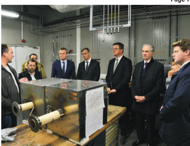
Hier, l'extension du hall technologique du Laboratoire universitaire des sciences appliquées de Cherbourg (Lusac), a été inaugurée par un certain nombre d'élus. Le site abrite dorénavant plus d'une quarantaine de chercheurs.

Cherbourg. Extension du Lusac Le pôle de recherches inauguré Page 7