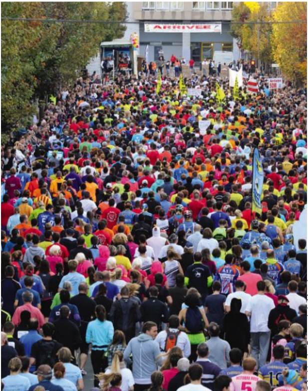
Encore 24 heures avant les 36 es Foulées de La Presse de la Manche. Si vous n'êtes pas encore inscrit, rien n'est perdu.

Musique. Rendez-vous soniques Christophe, toujours un succès fou