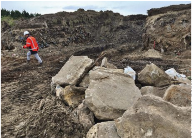
Le vaste chantier pour nettoyer le site de la décharge sauvage de la Samaritaine, à Lingreville, entre dans sa dernière phase. Plus de 4 000 m 3 de déchets doivent être traités sur place et évacués d'ici janvier 2018. Les sédiments vont autant que possible être réutilisés pour le remodelage du site, classé en zone Natura 2000.

Handball. Proligue La JSC veut confirmer