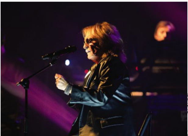
Décidément indémodable, Christophe a enchanté ses fans, mercredi soir à Saint-Lô, lors de l'ouverture du festival Les Rendez-vous soniques.

Lingreville. Travaux à la décharge La Samaritaine est passée au crible