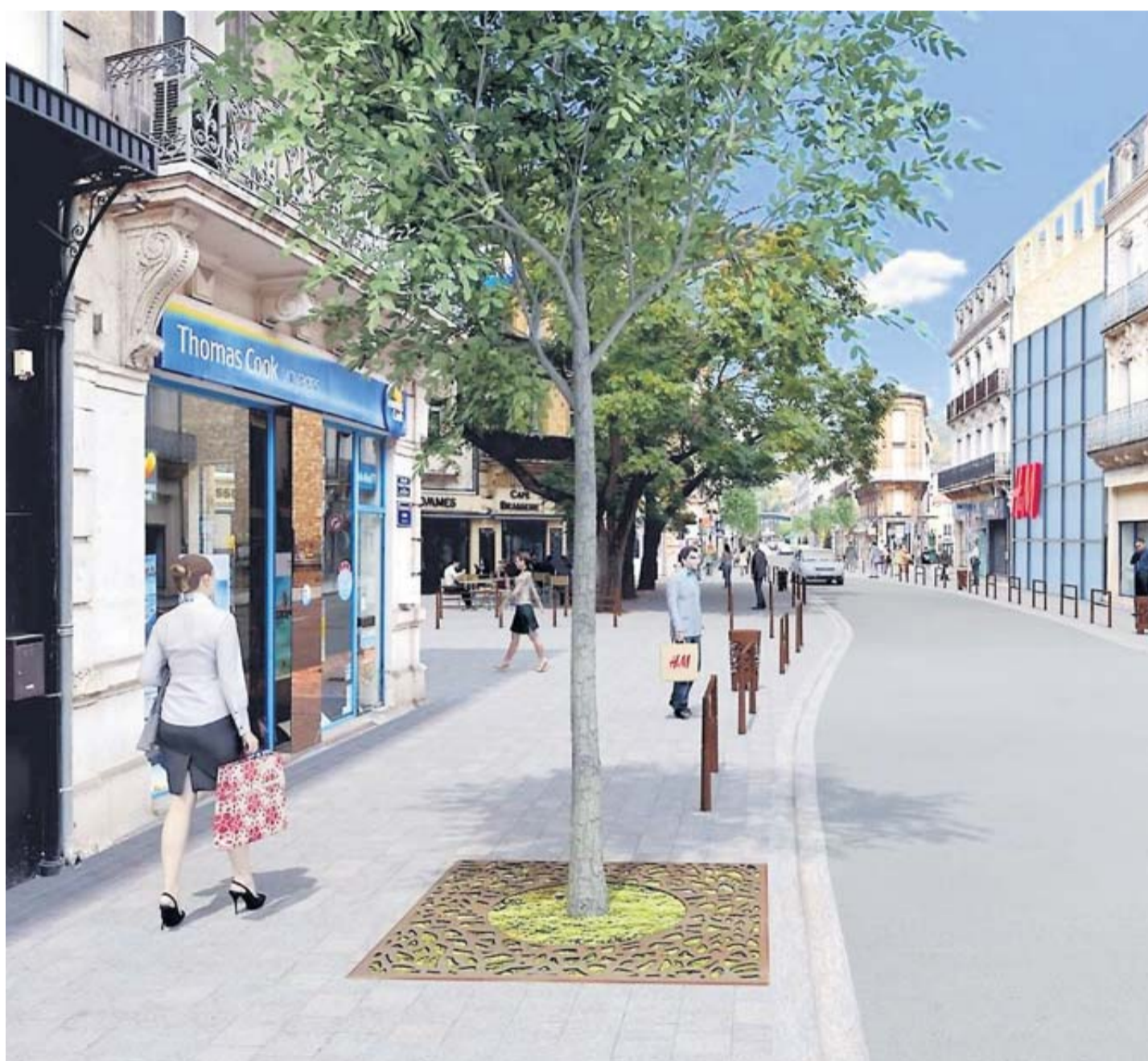
Document Ville d'Agen

Élus et commerçants veulent aller vite et tablent sur des travaux express, de mars à novembre 2018, pour une réfection totale du boulevard Carnot. Mais la circulation automobile sera considérablement perturbée le temps du chantier. Que diront les riverains, invités ce soir à l'hôtel de ville d'Agen ?