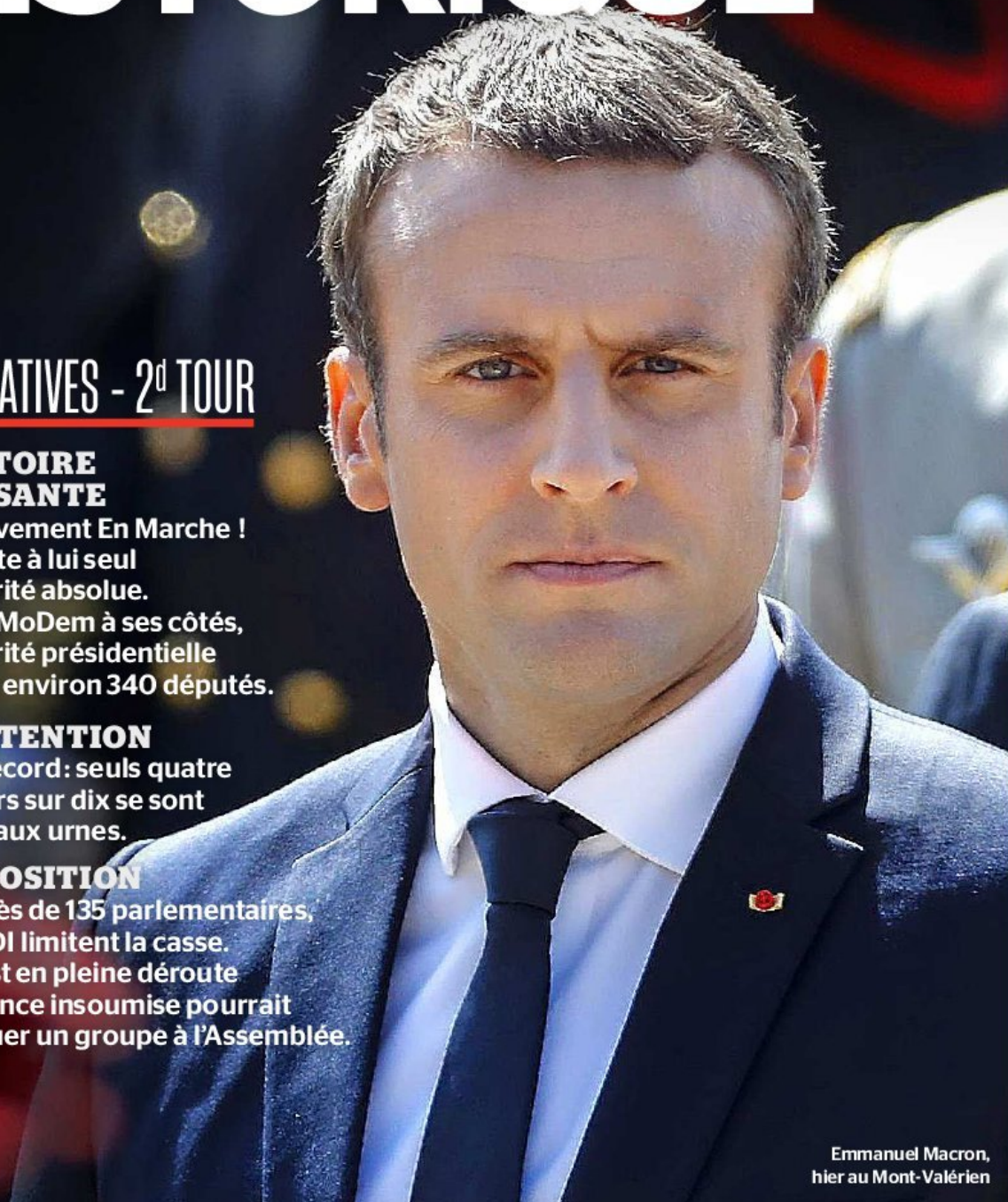
Emmanuel Macron, hier au Mont-Valérien

Avec près de 135 parlementaires, LR et UDI limitent la casse. Le PS est en pleine déroute et la France insoumise pourrait constituer un groupe à l'Assemblée.