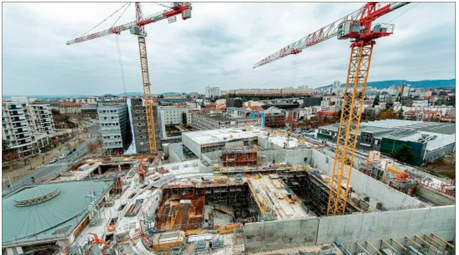
PAGES 2 ET 3

La Montagne enfile son casque de chantier pour vous proposer un tour d'horizon des grands projets qui vont changer la physionomie du département. À l'image de la Scène nationale, le futur lieu de la Comédie de Clermont dont la livraison est prévue fin 2019.