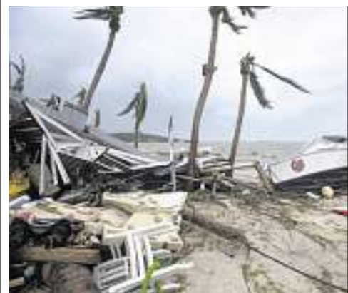
■ Jose, nouvelle menace sur les Antilles.

Après Puerto Rico et Cuba, la Floride frappée par Irma