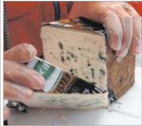
■ Le pays interdit son importation.

Le roquefort, un fromage devenu indésirable en Chine