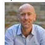
PAR FRÉDÉRIC BARILLÉ

Le MSB, Le Mans FC, les 24 Heures bientôt centenaires : le territoire démontre qu'en la matière toutes les ambitions ont leur place. Elles sont complémentaires, pas concurrentes. Leurs racines profondes. Et à travers la participation des élus politiques dans la gestion des infrastructures (circuit), des clubs (basketball) et leurs exigences envers les nouveaux patrons de la Pincenardière, c'est un peu chaque Sarthois qui se trouve associé à ces éclatantes réussites comme aux mauvaises passes.