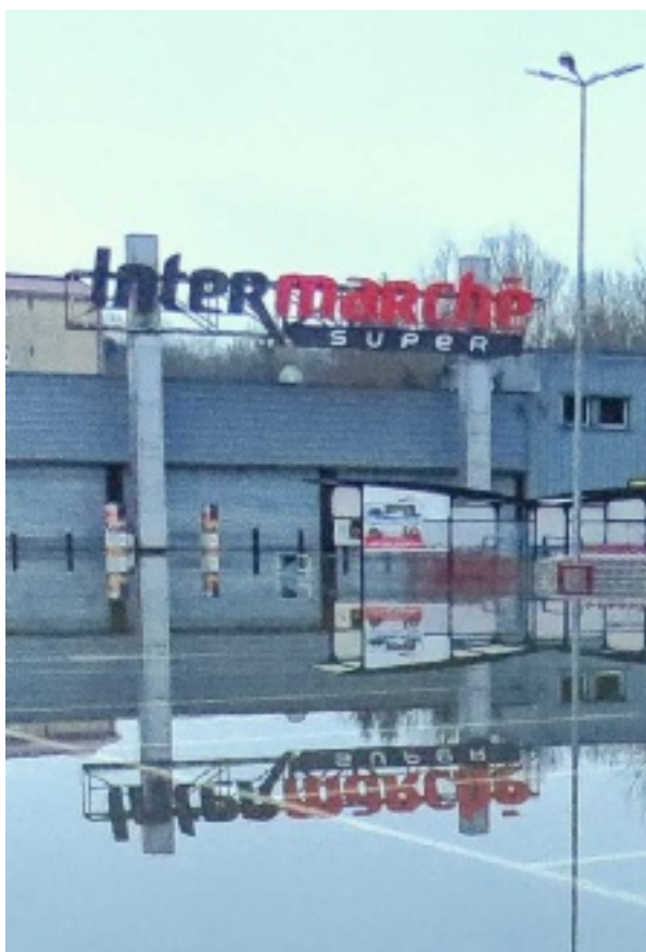
Le supermarché va devoir fermer au moins un mois suite à l'inondation C.Battelier

BAR-SUR-SEINE. Le magasin Intermarché de la commune a vécu sa deuxième inondation en cinq ans. Il sera fermé au moins un mois. P.9