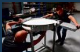
• Usemica : sous-traitant en plein essor