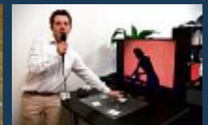
• L'actu de Lab'O