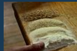
• Le Moulin des Gaults, farine d'excellence