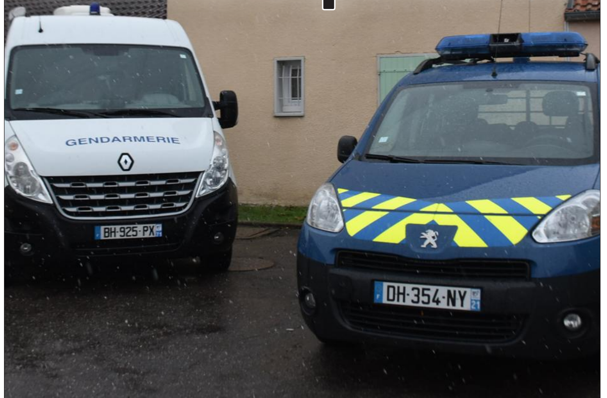
■ La cellule d'identification criminelle de la gendarmerie était à Chauffailles, ce samedi, pour enquêter suite à la découverte d'un fœtus sans vie dans une poubelle. La mère a été transportée à l'hôpital de Roanne (Loire).