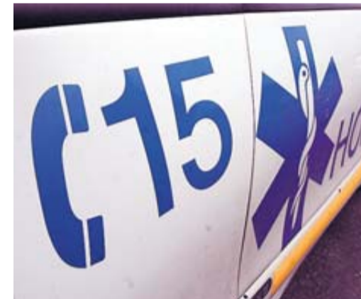
La famille veut savoir ce qu'il s'est passé./ DDM, illustration

Le parquet de Cahors a ouvert hier une enquête préliminaire après la plainte d'une famille reprochant une intervention trop tardive du Samu. • page 6