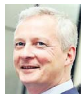
Bruno Le Maire vient débattre avec les Gersois./