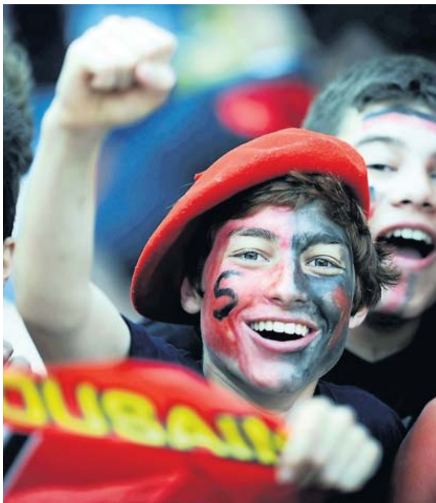
Le club incite les supporters du Stade à arborer les couleurs rouge et noir.

Le match de barrage qualificatif pour la demi-finale de Top14, Stade Toulousain-Castres aura lieu samedi à Toulouse. Pour soutenir les joueurs, le club invite tous les Toulousains à s'habiller en rouge et en noir dès vendredi. • pages 13, 18 et 19