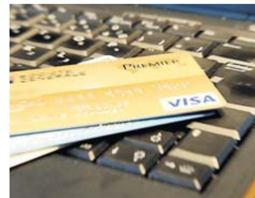
Un mode opératoire difficile à détecter.

Les escroqueries à la carte bancaire explosent