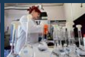
Isaltis, à la conquête du monde