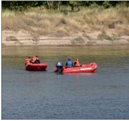
Les sapeurs pompiers lors de leur opération de recherche.