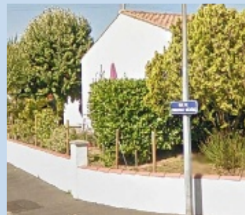
Rue de Charleville-Mézières : tout un quartier de la préfecture de Charente-Maritime rend hommage à notre département.

Rue de Charleville-Mézières, rue de Rocroi, rue des Ardennes, squares de Sedan et de Rethel. Vous n'êtes pas au pays de Woinic mais bien à La Rochelle. PAGE 8