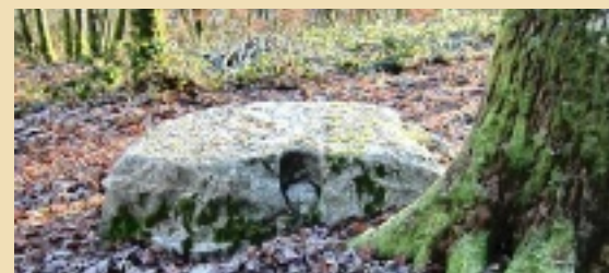
Selon les Harnicots, cette roche en forme de demi-lune porte l'empreinte de sabot du cheval Bayard.