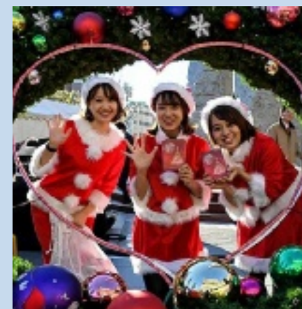
Au Japon aussi, on sort les costumes et décorations.

Comment Noël est-il fêté dans nos villes jumelles ? Réponse en Autriche, au Burkina Faso et au Japon, où Lida est jumelée à Charleville-Mézières.