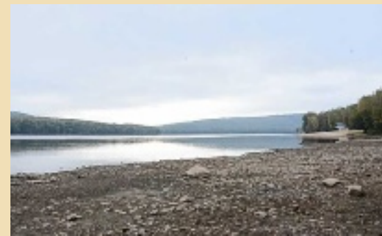
Le niveau du lac entraîne l'annulation de plusieurs manifestations.