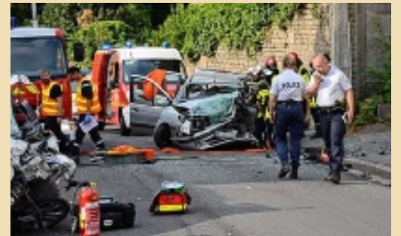
Les deux conductrices ont dû être désincarcérées. Boris Marois