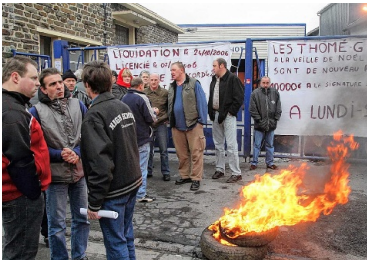
« C'est scandaleux d'indemniser le préjudice moral de patrons voyous », dit l'avocat des salariés.

Les patrons américains de Thomé-Génot avaient été condamnés à cinq ans de prison. L'État devra cependant les indemniser à hauteur de 30 000 €. PAGE 3